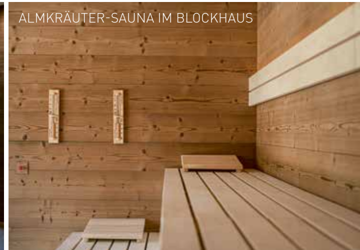
ALMKRÄUTER-SAUNA IM BLOCKHAUS