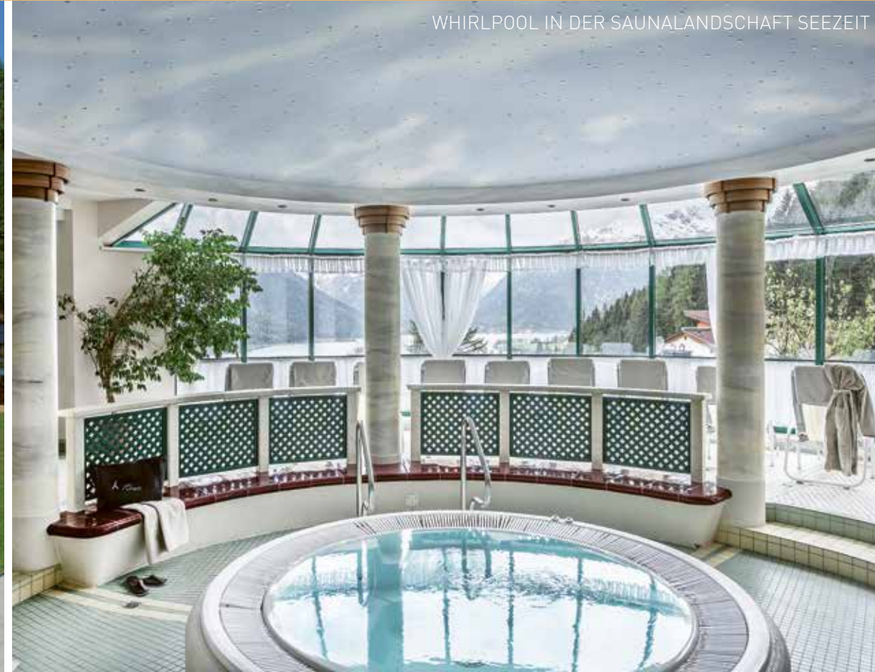
WHIRLPOOL IN DER SAUNALANDSCHAFT SEEZEIT