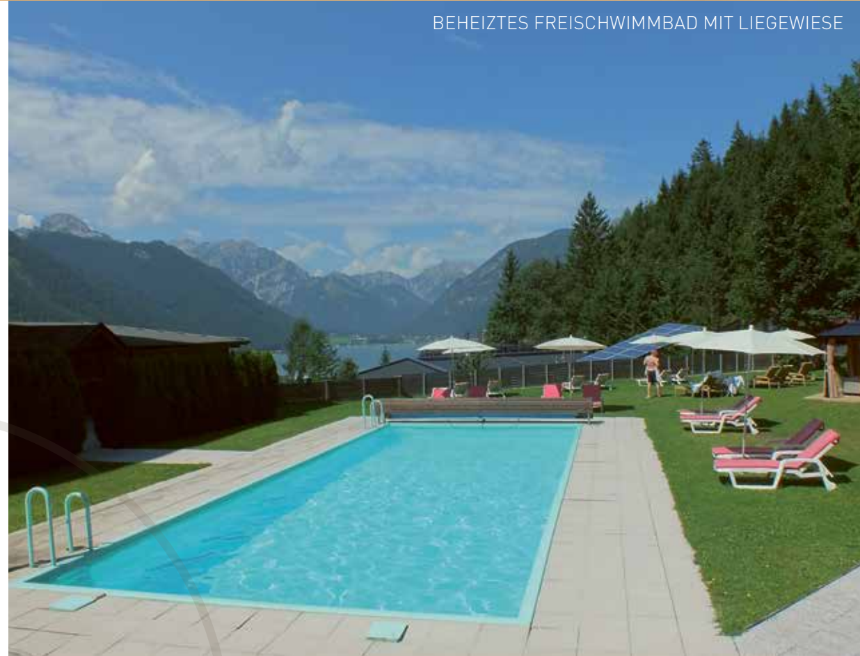
BEHEIZTES FREISCHWIMMBAD MIT LIEGEWIESE