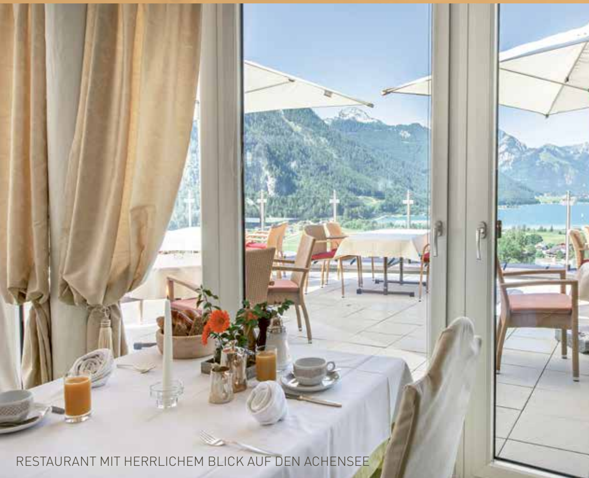
RESTAURANT MIT HERRLICHEM BLICK AUF DEN ACHENSEE